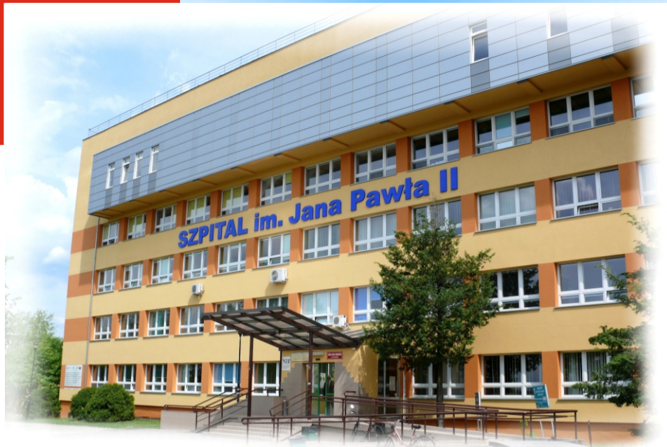
SZPITAL im. JANA PAWŁA II WE WŁOSZCZOWIE